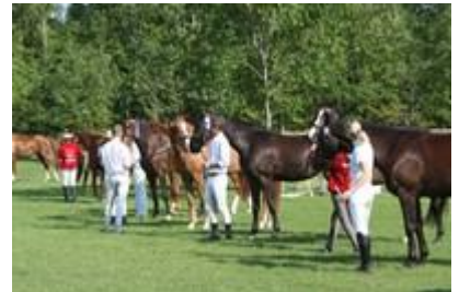
Holdet oprangeres og præmieres. Fløjhoppen vises på cæresrunde og evt. hopper til dagens finale og/el. Eliteskuet udpeges