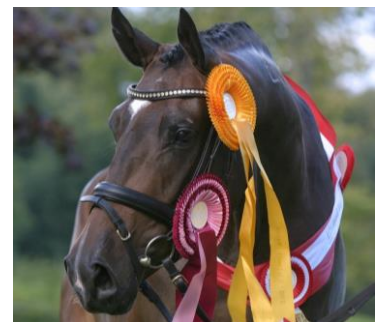
Nogle hopper ser vi igen til Krafft Eliteskue...