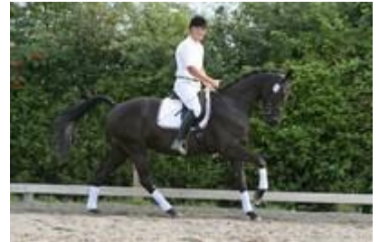
...og testes herefter af Dansk Varmblods testrytter