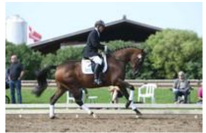
Hoppen fremvises i gangarter m. egen rytter