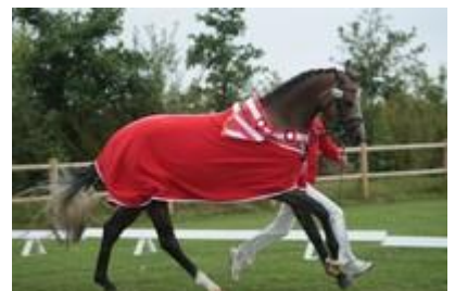
"Dagens bedste hoppe" udnævnes i henholdsvis dressur og spring, alt efter hvad regionen afholder