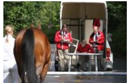
Hoppen vises på fast bund, hvor eksteriørkaraktererne gives