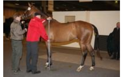
Besigtigeren måler og tager signalement af hoppen. Passet/originale papirer afleveres.