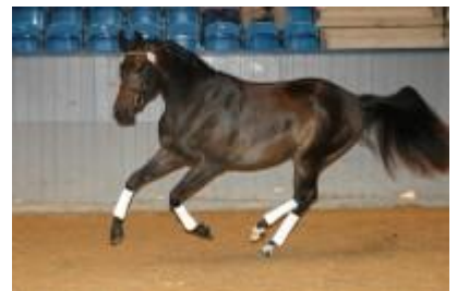
Hopper til eksteriørkåring fremvises løs i hallen