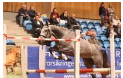
Løsspringning for sadelkåring hopper tilmeldt springdisciplinen og hopper til eksteriørkåring m. løsspringning